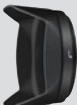
Osłona z mocowaniem bagnetowym HB-75 (w zestawie)